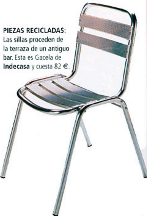
PIEZAS RECICLADAS: Las sillas proceden de la terraza de un antiguo bar. Esta es Gacela de Indecasa y cuesta 82 €.

La escalera tiene una estructura de hierro pintado en blanco, en la que se han fijado los escalones, unas piezas de mármol blanco de Carrara. A pesar de su carácter escultural, por su diseño sin contrahuella, resulta muy ligera y no agobia, aunque se perciba desde cualquier rincón de la casa.