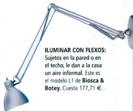
ILUMINAR CON FLEXOS: Sujetos en la pared o en el techo, le dan a la casa un aire informal. Este es el modelo L1 de Biosca & Botey . Cuesta 177,71 €.