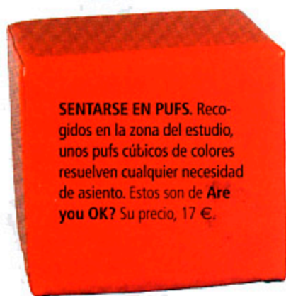
SENTARSE EN PUFOS. Recogidos en la zona del estudio, unos pufs cúbicos de colores resuelven cualquier necesidad de asiento. Estos son de Are you OK? Su precio, 17 €.