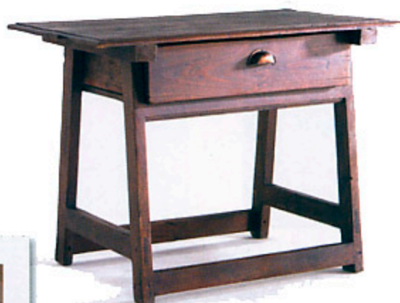
MUEBLE POPULAR: Algunos detalles, como las mesillas de noche o el arcón que acoge la televisión recuerdan el origen rústico de la vivienda. Este arcón es de Conely y cuesta 286 €.