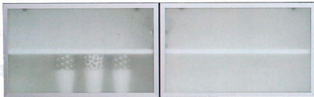
COCINA TODO TERRENO: Con muebles altos en aluminio y vidrio. Estos módulos son de Bo Concept y cuestan 427 €.

La sencillez es la característica de esta casa y su decoración –con una mezcla de soluciones y un estilo informal– ayudan a conseguirlo.